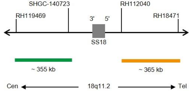
Şekil 1: SPEC SS18 Probe yapısı (ölçekli değildir)

ZytoLight SPEC SS18 Dual Color Break Apart Probe iki şekilde temin edilir: