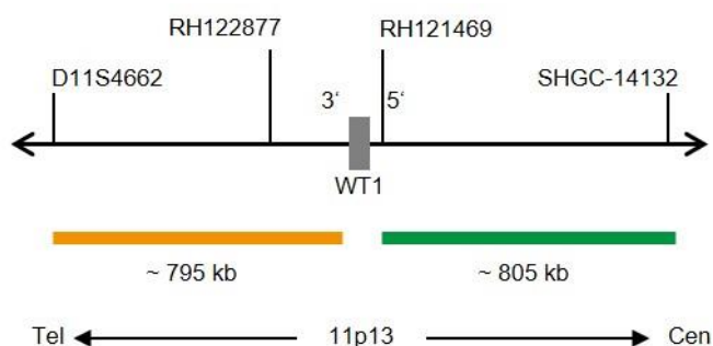
Fig. 1: SPEC WT1 Mappa della sonda (non in scala)

*conformemente al Human Genome Assembly GRCh37/hg19