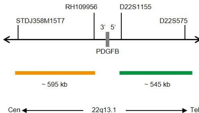
Fig. 1 : Carte de la sonde SPEC PDGFB (pas à l'échelle)

* selon Human Genome Assembly GRCh37/hg19