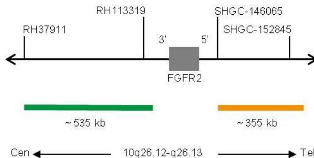
Obr. 1: SPEC FGFR2 Mapa sondy (mimo měřítko)

* V souladu s knihovnou lidského genomu GRCh37/hg19